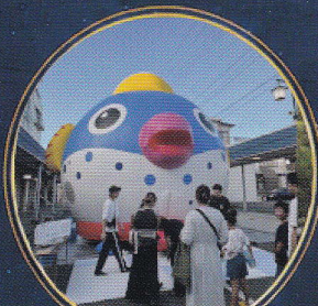
長府商店街 (7月4日のみ)